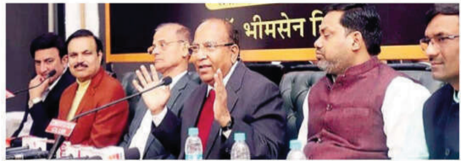
जानकारी देते गणमान्य।

दिल्ली। हम महान फिल्म निमार्ता श्याम बेनेगल के निधन से बहुत दुखी हैं, जो भारतीय सिनेमा में एक महान हस्ती थे और समानांतर सिनेमा आंदोलन के सच्चे अग्रदूत थे। कला के क्षेत्र में उनके जबरदस्त योगदान, विचारोत्तेजक कहानी कहने और सामाजिक मुद्दों के प्रति गहरी प्रतिबद्धता ने एक अमिट छाप छोड़ी है। पंडित नेहरू की द डिस्कवरी ऑफ इंडिया पर आधारित भारत, एक खोज और संविधान सभा की बहसों पर आधारित श्रृंखला संविधान जैसी उनकी कृतियाँ युवा दर्शकों के लिए एक मूल्यवान संदर्भ बिंदु हैं। प्रतिष्ठित पद्म भूषण और दादा साहब फाल्के पुरस्कार के साथ-साथ 18 राष्ट्रीय फिल्म पुरस्कारों से सम्मानित, उनकी विरासत फिल्म निमार्ताओं की पौष्टियों को प्रेरित करती रहेगी। उनके परिवार, दोस्तों और प्रशंसकों के प्रति हमारी हार्दिक संवेदनाएँ।