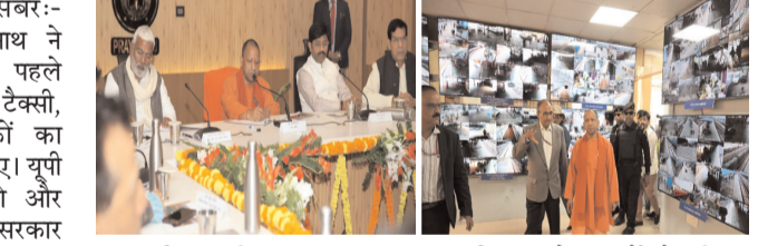
सुदृढीकरण के कार्यों के लिए 05 जनवरी अंतिम तारीख तय की है। उन्होंने कहा है कि महाकुम्भ में सर्वाधिक श्रद्धालु सड़क मार्ग से होकर आएंगे। अयोध्या, वाराणसी, लखनऊ और मीरजापुर की ओर से बड़ी संख्या में लोगों का आगमन होगा। इसलिए शीघ्र प्राथमिकता के साथ प्रयागराज आने वाले सभी मार्गों के नवनिर्माण/सुदृढीकरण के कार्यों को पूरा कर लिया जाए। इसमें किसी प्रकार की कोताही नहीं होनी चाहिए। उन्होंने अधिकारियों को यह भी निर्देश दिए कि इन मार्गों पर यदि कहीं भी अतिक्रमण किया गया हो, तो कठोरतापूर्वक कार्यवाही करते हुए उसे हटाया जाए।

लखनऊ। 23 दिसंबर:- मुख्यमंत्री योगी आदित्यनाथ ने कहा है कि महाकुंभ से पहले प्रयागराज में चल रहे सभी टैक्सि, ऑटो, ई-रिक्शा चालकों का पुलिस सत्यापन कराया जाए। यूपी पुलिस को इंटेलिजेंस को और बेहतर करने तथा भारत सरकार की सुरक्षा एजेंसियों के साथ लगातार संवाद-सम्बन्ध बनाये रखने के निर्देश देते हुये मुख्यमंत्री ने कहा कि हाल के समय में प्रयागराज के आस-पास माफियाओं पर बड़ी कार्रवाई हुई है, यह सुनिश्चित किया जाए कि महाकुम्भ से पहले उनके गुर्गों पर आवश्यकतानुसार कार्रवाई तेज की जाए। सोमवार को प्रयागराज में महाकुम्भ की तैयारियों की समीक्षा करते हुए कहा कि प्रधानमंत्री जी ने 'सुरक्षित महाकुम्भ' की परिकल्पना की है। इसके दृष्टिगत सभी आवश्यक प्रबंध किए जाएं। सुरक्षा बलों की तैनाती के बारे में जानकारी लेते हुए मुख्यमंत्री ने कहा कि अब तक जिन 20 हजार पुलिसकार्मिकों को तैनाती हुई है,