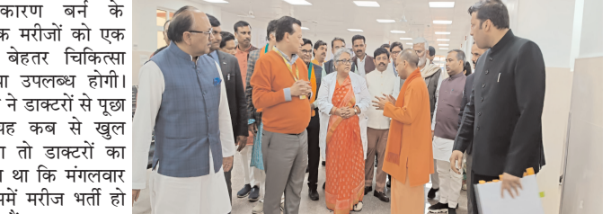
के कारण बर्न के अधिक मरीजों को एक साथ बेहतर चिकित्सा सुविधा उपलब्ध होगी। सीएम ने डाक्टरों से पूछा कि यह कब से खुल जाएगा तो डाक्टरों का कहना था कि मंगलवार से इयंमें मरीज भर्ती हो सकते हैं।