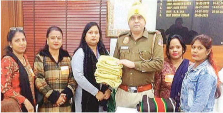
पुलिस थानों में सेवा अभियान चलाते कार्यकर्ता।