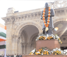
लखनऊ, 23 दिसंबर: मुख्यमंत्री योगी आदित्यनाथ ने कहा कि चौधरी चरण सिंह का जन्मदिवस उत्तर प्रदेश में 2002 से 'किसान सम्मान दिवस' के रूप में मनाया जाता है। चौधरी साहब कहा करते थे कि किसान गरीब होगा तो भारत अमीर नहीं हो सकता। भारत को समृद्ध बनाने के लिए अनन्यता किसान को समृद्ध बनाना पड़ेगा। इसे ध्यान में रखकर पीपल मोदी के नेतृत्व में डबल इनसुर सरकार द्वारा किसानों के उत्थान के लिए निरंतर कार्य हो रहे हैं। किसानों के लिए 2014 से जो प्रयास प्रारंभ हुआ, दुनिया उसे मॉडल के रूप में ले रही है। मुख्यमंत्री सोमवार को पूर्व प्रधानमंत्री 'भारत रत्न' चौधरी चरण सिंह की 122वीं जयंती 'किसान सम्मान दिवस' पर आयोजित कार्यक्रम में शामिल हुए। मुख्यमंत्री ने विधानसभा स्थित चौधरी चरण सिंह की प्रतिमा पर माल्यार्पण किया। इसके बाद मुख्यमंत्री कृषक उपहार योजना के अंतर्गत 11कृषकों को ट्रैक्टर की चाबी दी और हरी झंडी दिखाकर खाना किया। किसानों के मुद्दे पर चौधरी साहब का कांग्रेस से हुआ था मतभेद सीएम ने कहा कि आजादी के बाद किसानों के मुद्दों को लेकर चौधरी चरण सिंह जी का कांग्रेस के साथ मतभेद हुआ था, लेकिन पीएम मोदी ने पहली बार किसानों को भारत के राजनीतिक एजेंडे व सरकार की प्राथमिकता बनाने का कार्य किया।स्वॉयल हेल्थ कॉर्ड, ऊनत किस्म की बीजा उपलब्ध कराने, खेती की तकनीक से जोड़ने, कृषक दुर्घटना बीमा योजना, प्रधानमंत्री फसल बीमा योजना, कृषि सिंचाई योजना, किसान सम्मान निधि आदि योजनाओं से किसानों की उन्नति के लिए कार्य किए जा रहे हैं।