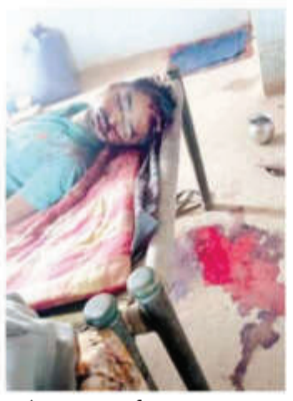
फतेहाबाद चारपाई पर मृत पड़ा युवक।