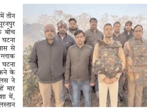
गोलीबारी की थी और वे पंजाब के सीमावर्ती इलाकों में पुलिस प्रतिष्ठानों पर ग्रेनेड हमलों में शामिल थे। घायल आतंकीयों को तुरंत इलाज के लिए अस्पताल ले जाया गया, जहां उनकी मौत हो गई। इस ऑपरेशन के दौरान दो एके राइफल और दो ग्लाक पिस्टल बरामद की गईं, जिससे इस मॉड्यूल की आगे किसी

रिपोर्ट-मंजीत शर्मा पीलीभीत पूरनपुर। पीलीभीत: पुलिस मुठभेड़ में तीन खालिस्तानी आतंकी ढेर,पीलीभीत जिले के पूरनपुर क्षेत्र में पुलिस और खालिस्तानी आतंकीयों के बीच हुई मुठभेड़ में तीन आतंकी मारे गए। यह घटना पूरनपुर क्षेत्र में हुई पुलिस ने आतंकीयों के पास से हथियार व अड-47 राइफल व दो ग्लाक पिस्टल,भारी मात्रा में कारतूस बरामद किए।पह घटना पीलीभीत जिले में आतंकी गतिविधियों को रोकने के लिए पुलिस की सक्रियता को दर्शाती है। पुलिस ने आतंकीयों के खिलाफ कार्रवाई करते हुए उन्हें मार गिराया। राष्ट्रीय सुरक्षा सुनिश्चित करने की दिशा में, न्यूपी पुलिस और पंजाब पुलिस ने मिलकर खालिस्तान जिंदाबाद फोर्स (डेफ़) के #पाक-प्रयोजित आतंकी मॉड्यूल से मुठभेड़ करते हुए एक बड़ी सफलता हासिल की। प्राप्त जानकारी को त्वरित कार्यवाही में बदलते हुए, दोनों पुलिस बलों ने पीलीभीत के पूरनपुर इलाके में इस मॉड्यूल के तीन सशस्त्र आतंकीयों के साथ मुठभेड़ की। इन आतंकीयों ने पुलिस टीम पर